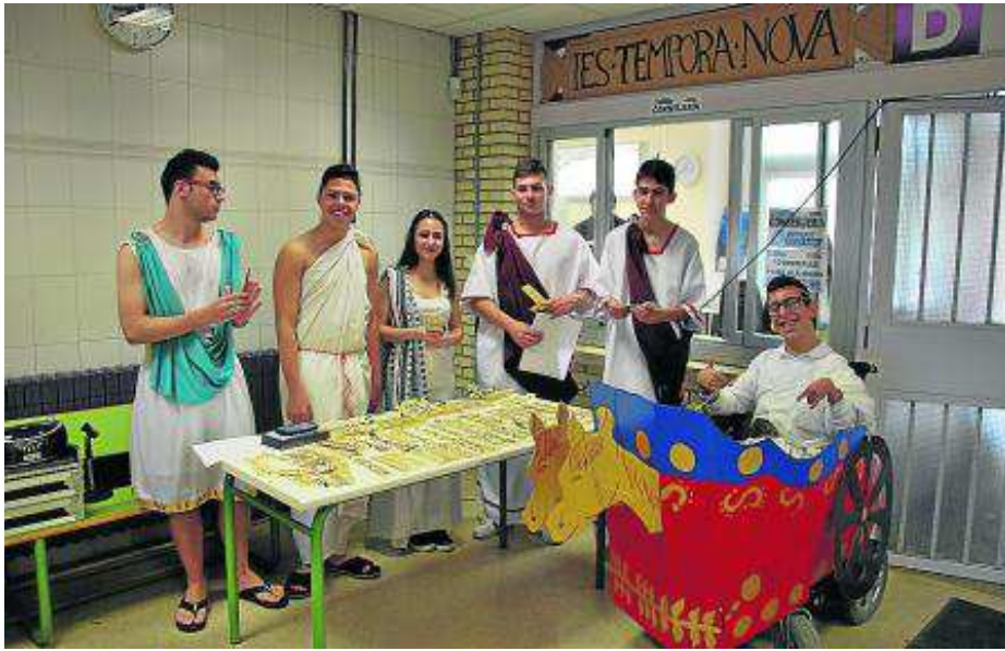
■ La implicación de los alumnos en las diferentes actividades organizadas en los seis institutos ha sido total.

El pasado 21 de abril, seis institutos aragoneses desarrollaron un completo programa de actividades en sus respectivos centros para reivindicar la enseñanza de las lenguas y cultura clásicas, en progresivo declive